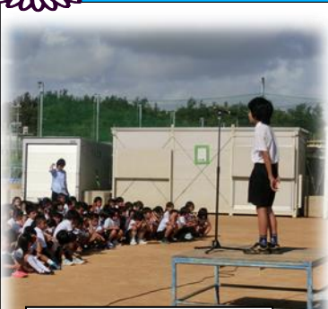
6年生(上)と3年生の代表発表

最後に「ヤッホッホ夏休み」を元気よく全員合唱しました。仮設運動場での暑い中でしたが、最後まで頑張つて話を聞く子どもたちを頼もしく感じました。