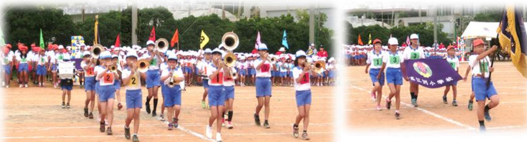
児童会役員の指揮とマーチングバンド部の演奏を先導に入場

運動会の開催中は降らなかった雨、涼しい風で暑さが和らいだ事、いい事続きの運動会となりました。全てに感謝!