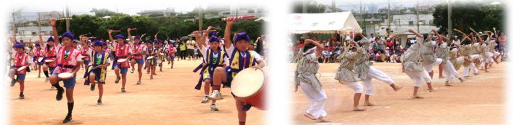
列の最後まで全員が見事な動作の6年生エイサー踊り