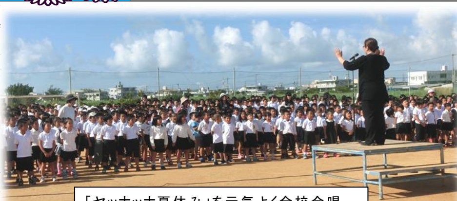
「ヤッホッホ夏休み」を元気よく全校合唱

7月17日(金) 子どもたちは一学期終業式を迎えました。4月7日にスタートし、69日間(一年生は68日)の授業日数を終えています。