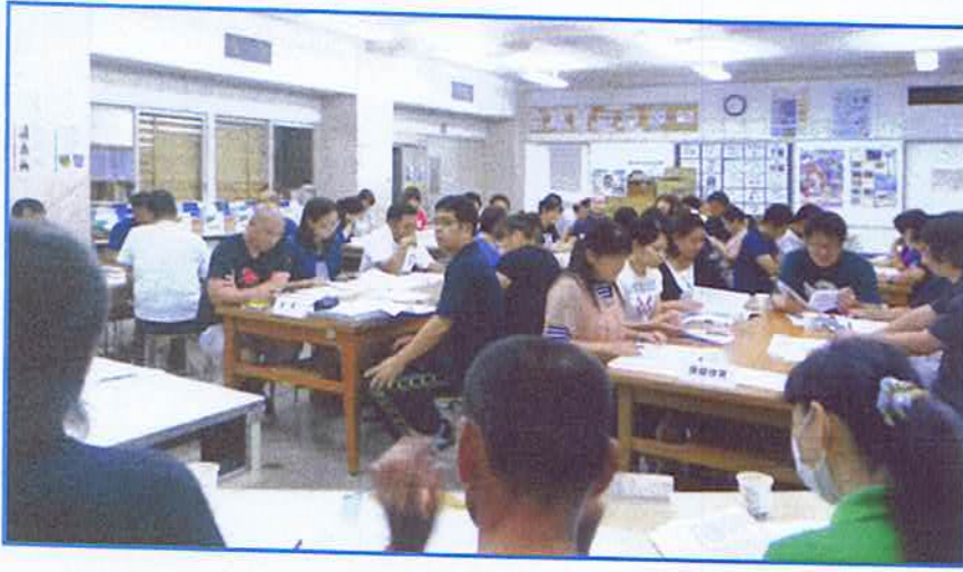
H27常置委員会 学年割り当てと役員名 (5.18時点)